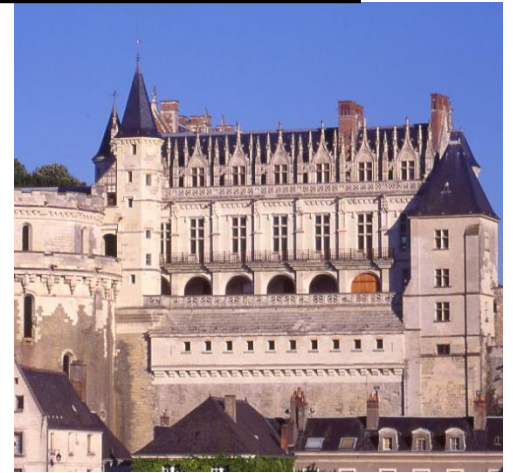
Le château d'Amboise

Regarde bien le film. Essaie ensuite de répondre aux questions, au crayon à papier.