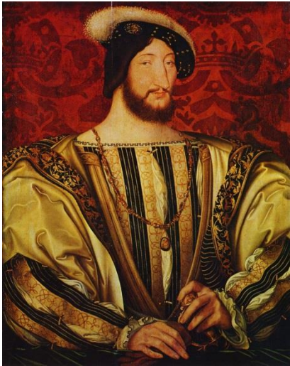
François 1 er