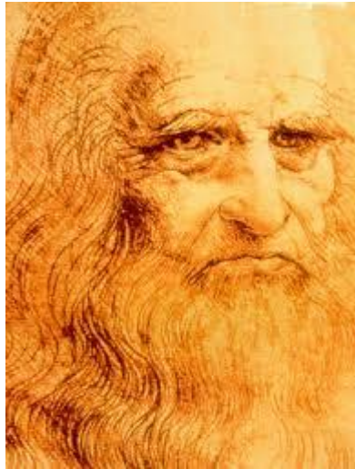
Auto portrait:Léonar de Vinci