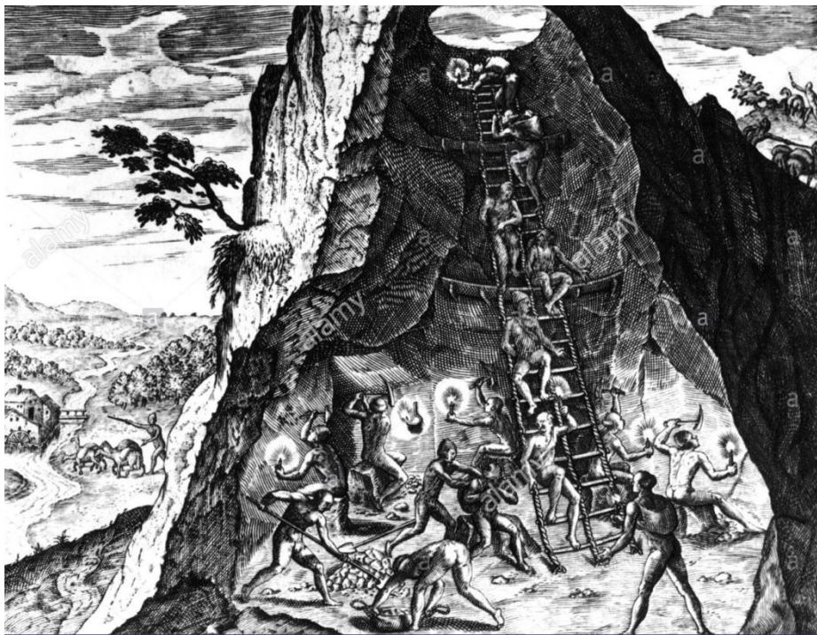
Gravure du XVIème siècle