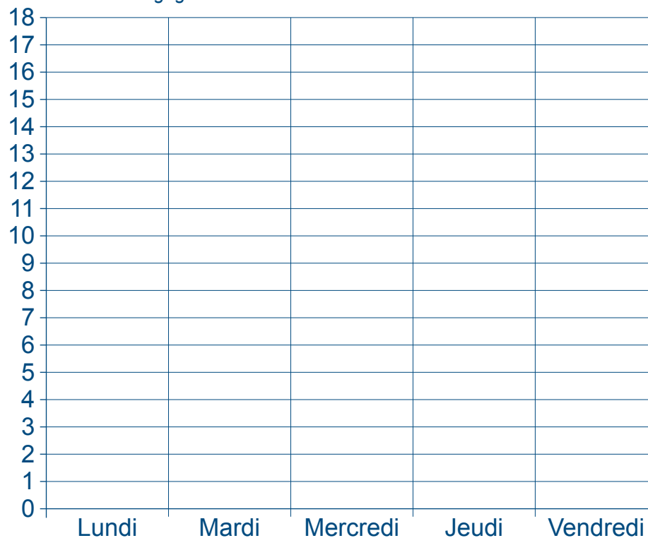
Nombre de billes gagnées